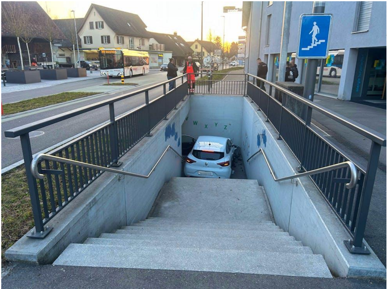
Hunzenschwil, März 2025: Statt den Fussgängern die Autos verlocken